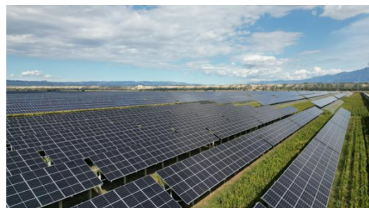
示意图 - 光伏项目