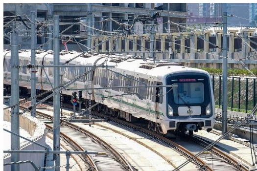
示意图 - 电气化轨道交通项目